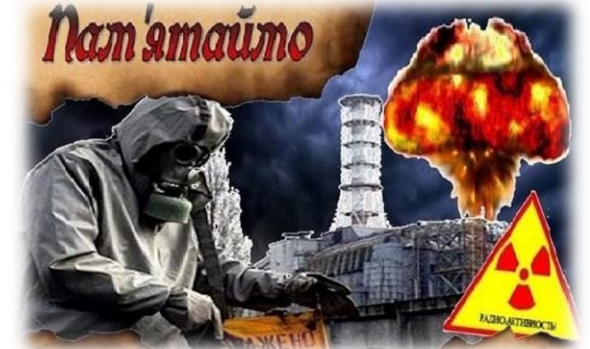
26 квітня Міжнародний день пам'яті Чорнобиля