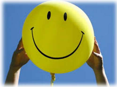
1 квітня День сміху