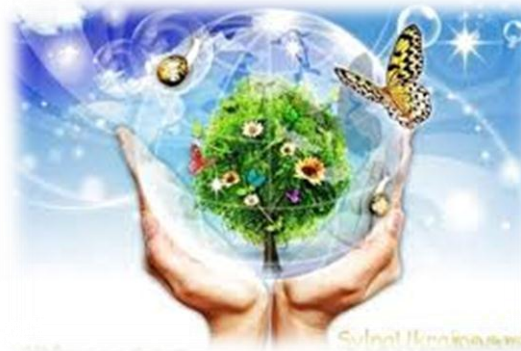
22 квітня Міжнародний день Землі