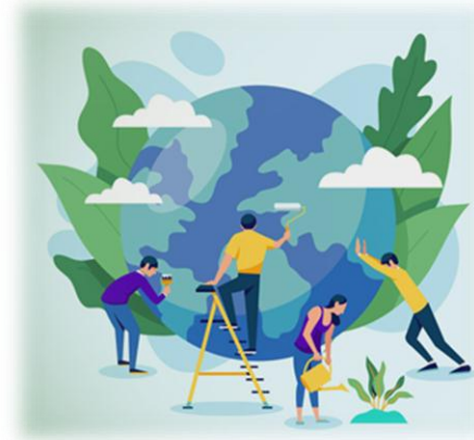
15 квітня День довкілля