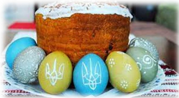
16 квітня Великдень