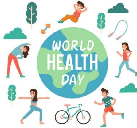
7 квітня Всесвітній день здоров'я