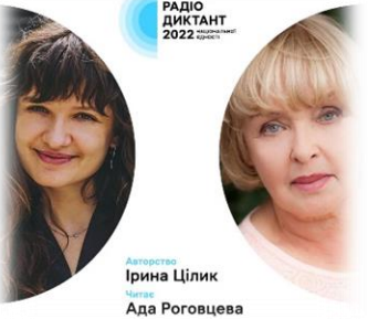
Автори: Ірина Цілик Ада Роговцева