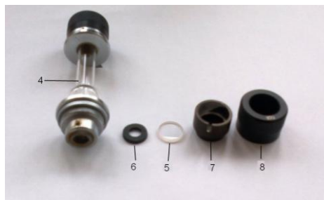
Мал. 3 Поляриметрична трубка

Оптично активні розчини, які підлягають дослідженню, повинні бути прозорими і не містити зважених часток. Поляриметричну трубку (4) акуратно наповнити досліджуваною рідиною до тих пір, поки на верхньому кінці трубки не з'явиться випуклий меніск. Відкритий кінець трубки обережно накрити покривним склом (5), на скло покласти гумову прокладку (6), притиснути втулкою (7) і затягнути гайкою (8) (мал. 3). Гайку затягнути так, щоб не було натягів в покривних стеклах і трубка не підтікала. Після наповнення трубки досліджуваної рідиною покривні скла з зовнішньої сторони ретельно протерти м'якою серветкою.